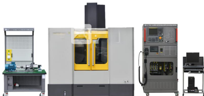
图 3 FANUC 系统类似平台