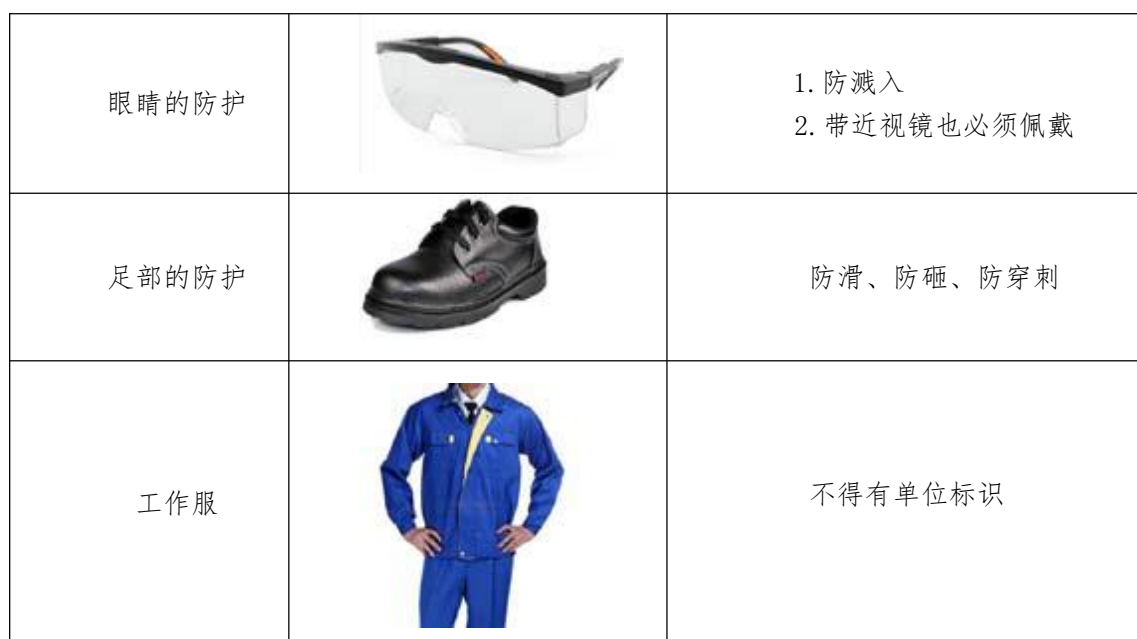
表14-2 选手防护装备佩带要求